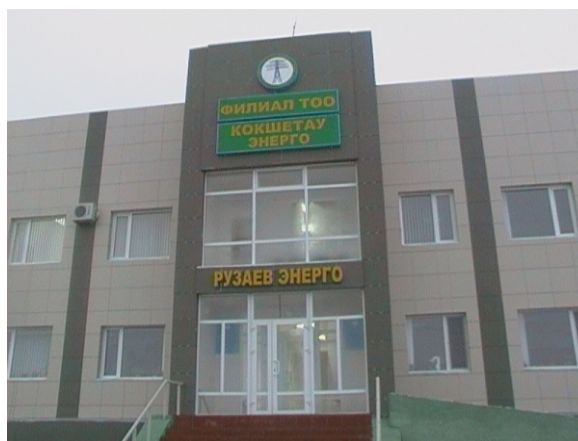
Новое здание Рузаевских ЭС