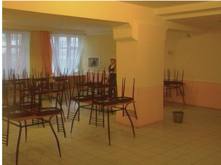
Столовая для персонала на базе КГЭС

В целях повышения производительности труда, качества выполнения работ, мобильности оперативно выездных бригад, бригад линейно-мастерских участков, бригад централизованного ремонта подстанций, улучшения условий труда электромонтеров компанией ТОО «Кокшетау Энерго» постоянно ведется работа по обновлению автомобильной и грузоподъемной техники, а также устройств и приборов применяемых при выполнении работ в электроустановках. В 2010г для этих целей приобретено три автомобиля УАЗ 3909, три автомобильных крана грузоподъемностью 16тн, 50 радиостанций ICOM.