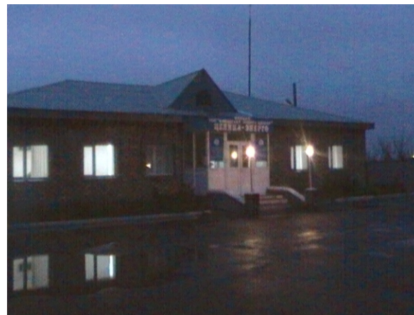
Новое здание Целинные РЭС