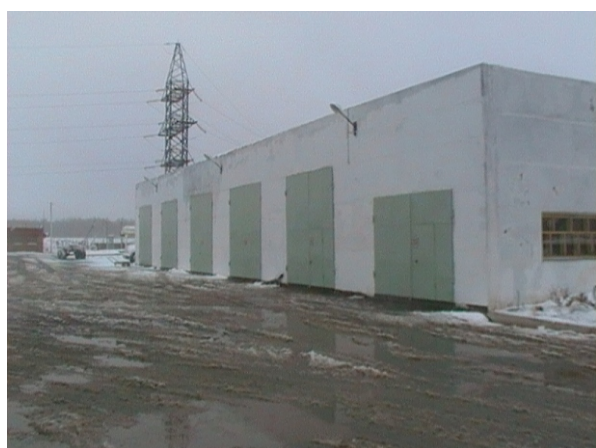
Новое здание гаража на базе Западных МЭС