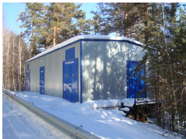
Новое здание ТП-10/0,4 типа «сэндвич»