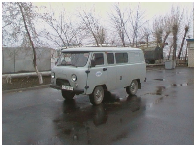
бригадный автомобиль УАЗ-3909