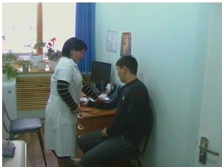
Предсменное освидетельствование персонала перед началом работы