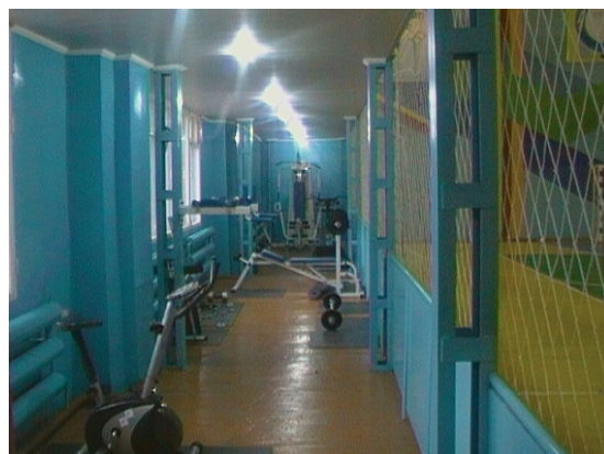
тренажёрный зал ТОО «Кокшетау Энерго»