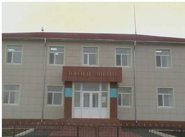
Новое здание Зерендинские РЭС