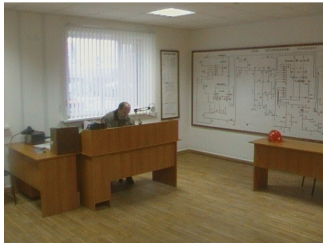
Диспетчерская служба Рузаевских ЭС