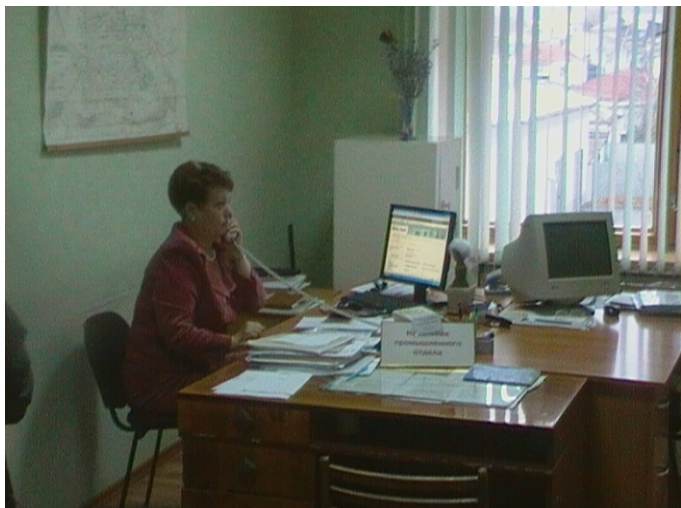
В таких условиях трудятся работники КГЭС