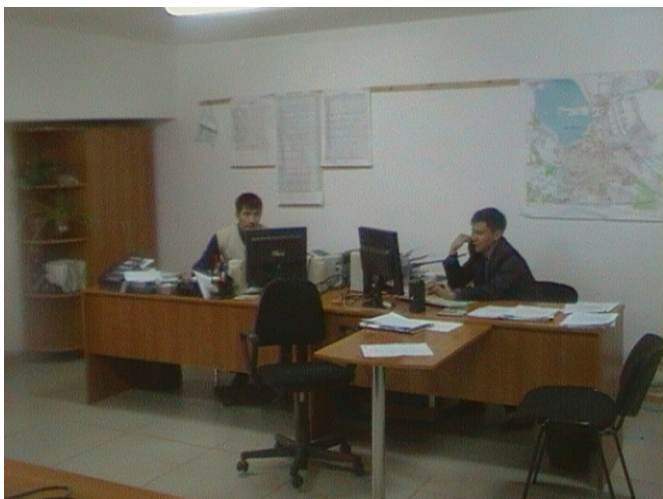
Условия труда Производственно технической службы после ремонта

На основании материалов аттестации рабочих мест по ТОО «Кокшетау Энерго» были разработаны мероприятия по улучшению безопасности условий труда. Выполнение данных мероприятий планируется осуществить в течении трех лет. На осуществление мероприятий производится ежегодное выделение средств, отчетность по исполнению мероприятий включена в ежемесячные отчеты главных инженеров МЭС, РЭС, КГЭС.