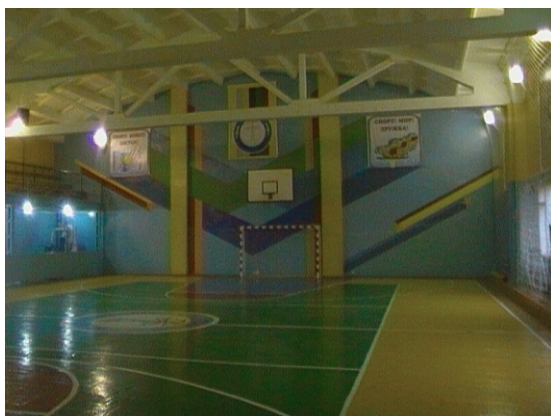
спортзал ТОО «Кокшетау Энерго»

Традиционным стало массовое участие персонала ТОО «Кокшетау Энерго» в таких соревнованиях проводимых в масштабах Республики Казахстан и центром ЗОЖ г.Кокшетау, как «Президентская миля», «Здоровая семья», «Зерендинский лыжный марафон»