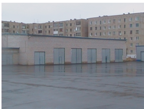
Новое здание гаража на базе ТОО “Кокшетау Энерго”