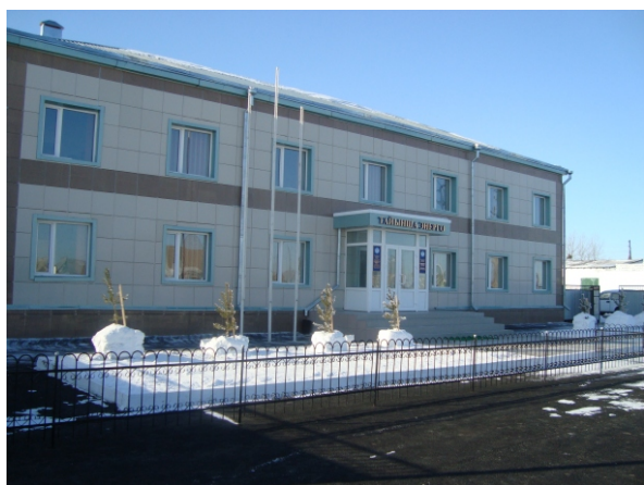
Новое здание Тайыншинского РЭС