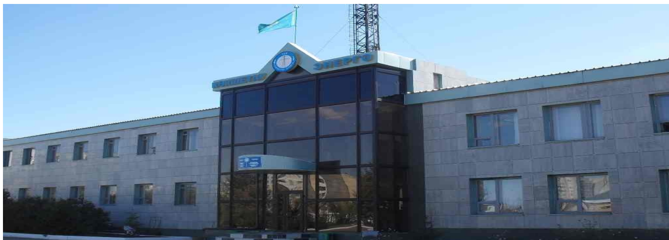
Головной офис ТОО “Кокшетау Энерго”