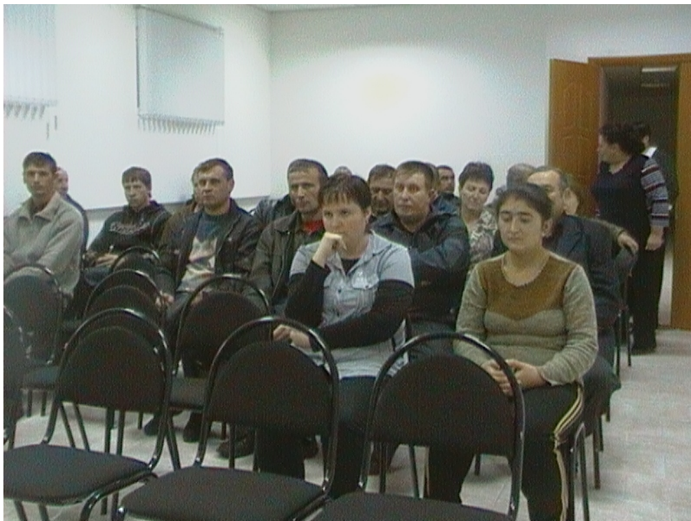
Лекция о здоровом образе жизни

В целях профилактики простудных заболеваний, а также для поддержания трудовой дисциплины во всех РЭС, МЭС, КГЭС и на базе ТОО «Кокшетау Энерго» организована доставка работников на работу, на обед и с работы.