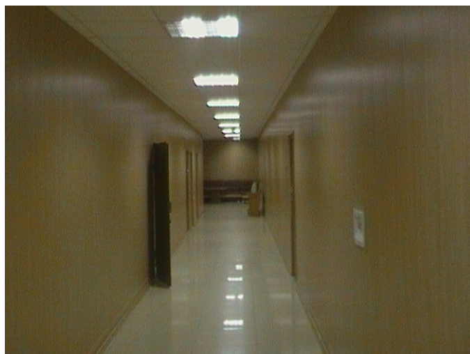
Помещение КГЭС после ремонта