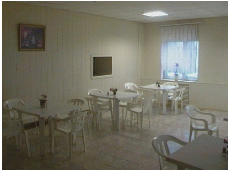
Столовая для персонала на базе ТОО «Кокшетау Энерго»

Персоналу, работающему во вредных условиях труда, согласно аттестации рабочих мест, выдается спец. питание(0,5л молока за смену).