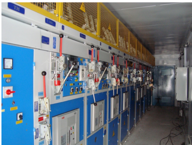
Комплектное распределительное устройство с вакуумными выключателями