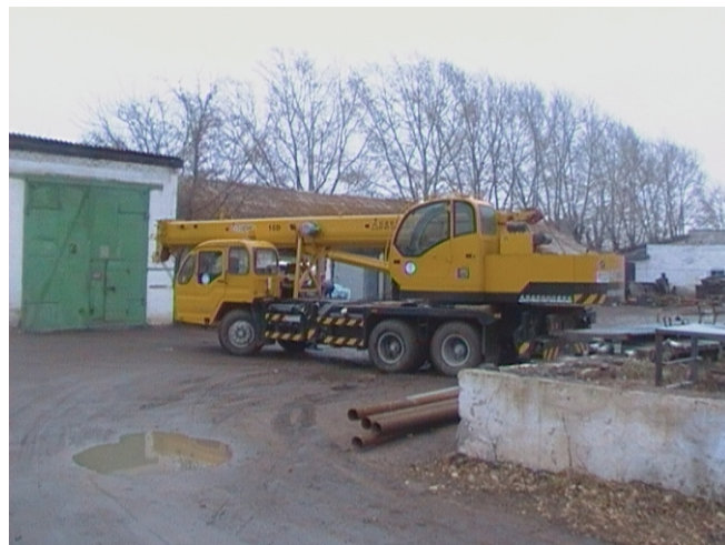
автокран грузоподъемностью 16 т.